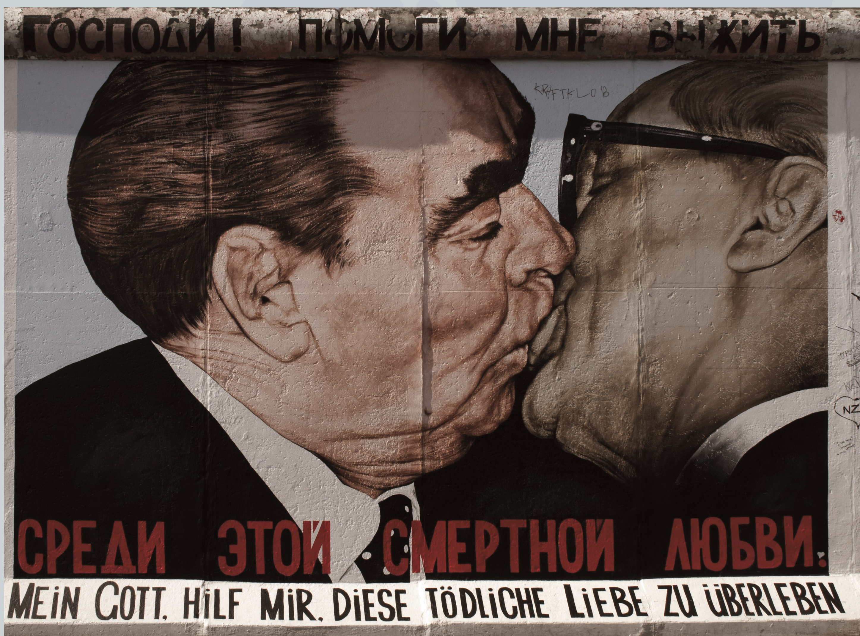
Abbildung 1 – Berliner Mauer

Wie wirkt sich die politische Sozialisation aus DDR und BRD auf die Paarbeziehung der Ost-West-Paare aus?